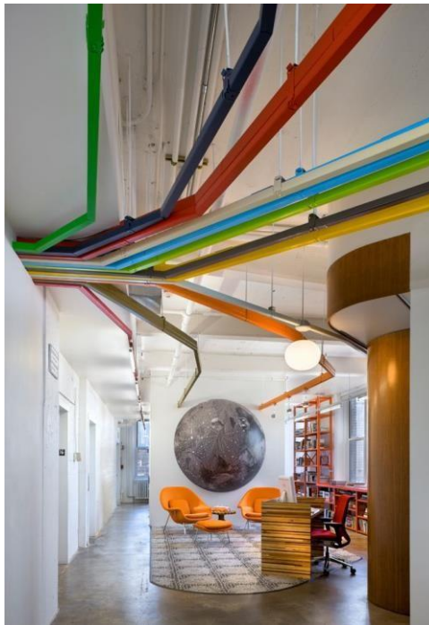
Рисунок 2 - Открытые вентиляционные трубы в интерьере.

Наиболее простой способ скрыть вентиляционные трубы – спрятать их под потолком. Такое решение подойдет для любого интерьера, но желательным для его реализации будут высокие потолки.