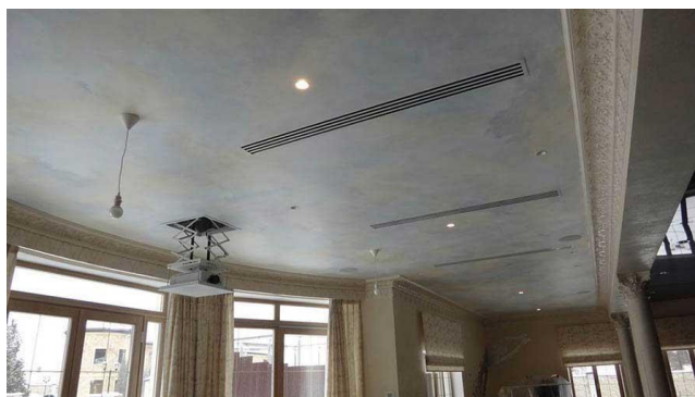
Рисунок 4 - потолок из ГКЛ.

рисунке 5 [4]. Хорошим вариантом визуально зонировать пространство потолком, можно использовать короба для вентиляции, но тут все будет зависеть от размещения вентиляционных труб на потолке.