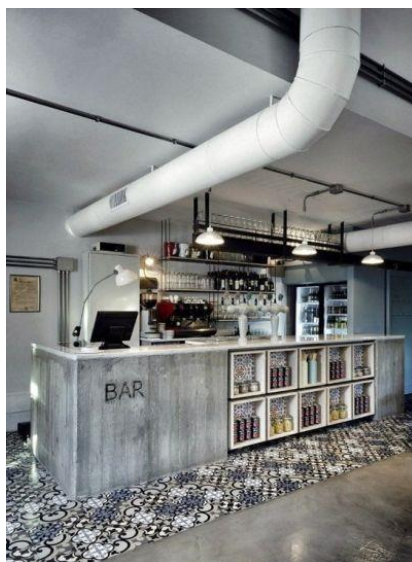
Рисунок 1 – Воздуховоды в интерьере бара.

Воздуховоды в дизайне интерьера можно использовать и как акцент дизайнерского решения. На сегодняшний день вентиляционные системы могут рассматриваться с позиции практических функций, но и декоративных свойств, привнося в интерьер помещения «изюминку». Не с каждым стилевым решением будет сочетаться вентиляция. Если помещение выполнено в классическом стиле, тогда лучшим решением для такого интерьера будет закрыть вентиляцию коробами. А вот в стиль лофт идеально впишутся вентиляционные трубы, как показано на рисунке 1 [3]. Так же необычные варианты оформления интерьера могут подойти и для стилей хай-тек, прованс, индустриал и даже кантри [1].